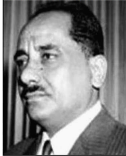
Qahtan Muhammad al-Shaabi

Yemen del Sur, era para la prensa occidental de aquella década de los setenta, como un “infierno rojo”, dentro de un mundo árabe y prooccidental. A pesar de las trabas que le pusieron, adoptó muchas reformas políticas, muy necesarias para el país, como reformas sociales, igualdad del hombre y la mujer, educación universal, servicios médico gratuitos.