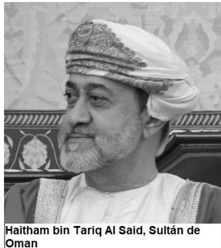
Haitham bin Tariq Al Said, Sultán de Omán

Le sucedió su primo Haitham bin Tariq, educado también en occidente. Ha seguido la senda de su predecesor.